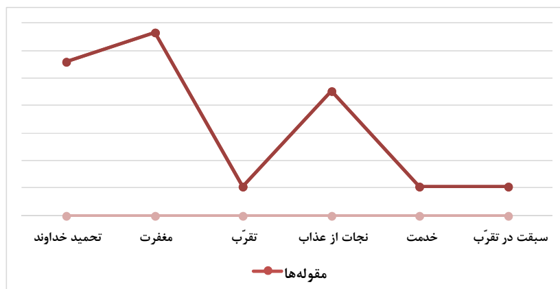
نمودار ۱. فراوانی مقوله‌ها

مقوله‌بندی فوق به این معناست که هر فراز و جمله‌ای از دعای کمیل، ذیل یکی از شش مقوله مزبور جانمایی می‌شود. فراوانی این مقوله‌ها در نمودار ذیل ترسیم شده است: